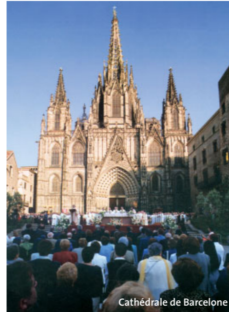
Cathédrale de Barcelone