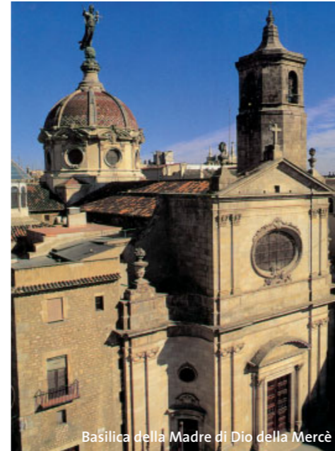
Basilica della Madre di Dio della Mercè