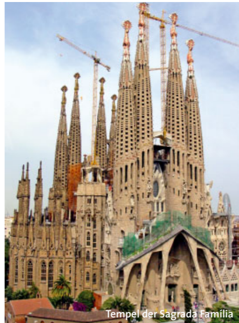
Tempel der Sagrada Família

† Lluís Martínez Sistach Kardinal - Erzbischof von Barzelona